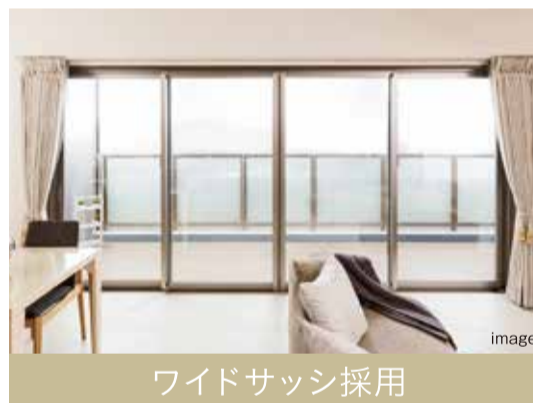
ワイドサッシ採用