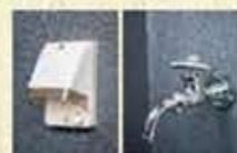
防水コンセント バルコニー水栓