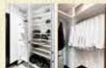
充実した収納スペース